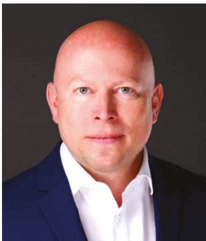
Stéphane Pallage Recteur

comment l'UQAM peut-elle mieux servir le Québec. Le résultat est un plan ambitieux pour l'Université, qui s'apprête à vivre de grands développements au bénéfice du Québec.